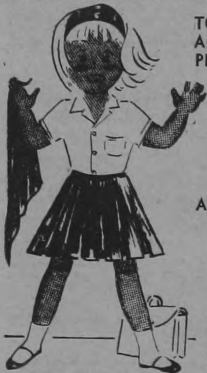
BLUSITAS DE POPLIN ₡ 9.50

Traiga a sus niños para que reciban un globo de hule absolutamente gratis... con su compra!!