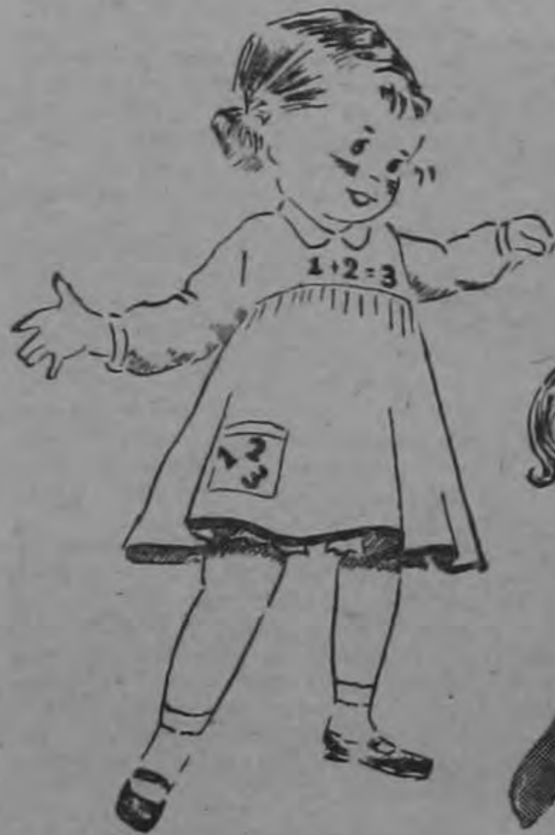
DELANTAL PARA KINDER ₡ 16

antes ₡ 27.50 de mezclilla; estilo cow boy, 10 onzas; zipper de trabajo perfecto. Costuras reforzadas. en nylon. Tamaños 4, 6, y 10.