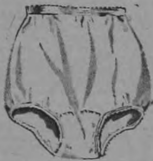
PANTIES DE ALGODON ₡ 4.95

De ₡ 31.50 ahora a ₡ 24 De ₡ 49.50 ahora a ₡ 34