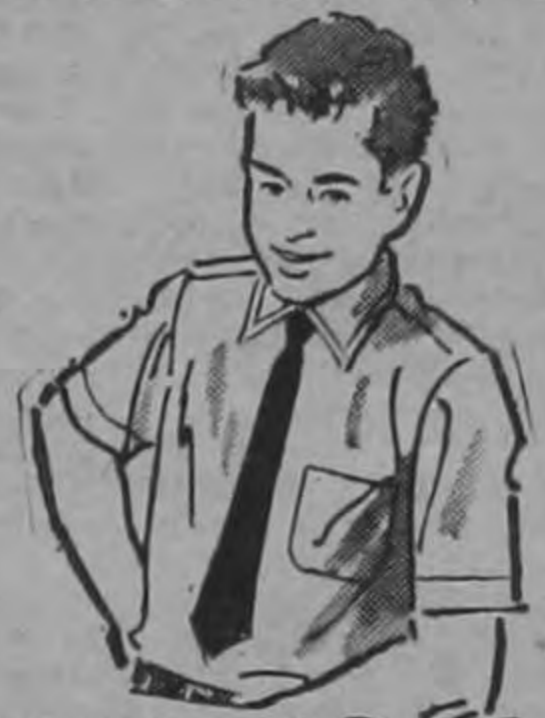
CAMISA BLANCA, poplín Cuello trubenizado. Del 6 al 12. ₡ 5.95

En colores azul y negro. Tallas única. Frescas y confortables.