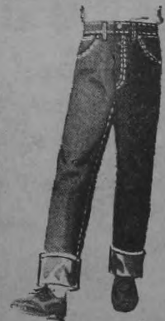
BLUE-JEAN ₡ 24

Pantalón de casimir Pacific, azul y negro, tallas del 70 al 85. De ₡ 24.50 ahora a ₡ 20 En tallas 90. De ₡ 29.50 ahora a ₡ 25 Pantalón de casimir azul. Talla 90 Colegio La Salle De ₡ 35 ahora a ₡ 30 De Army color café para Colegio Los Angeles. Del 95 al 110 de ₡ 33 ahora a ₡ 33 De casimir color café Los Angeles talla 90, de ₡ 49 ahora a ₡ 45 En tallas del 95 al 110. De ₡ 62.50 ahora a ₡ 54