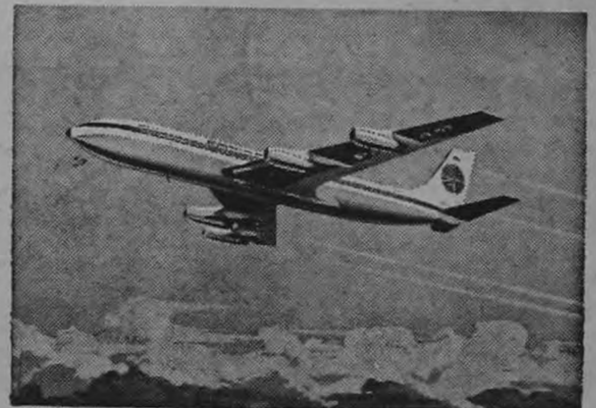
A su servicio... la flota de jets transoceánicos mayor del mundo.

Vayan para la encantadora cumpleaños y para los suyos, nuestros más sinceros votos de constante dicha y ventura.