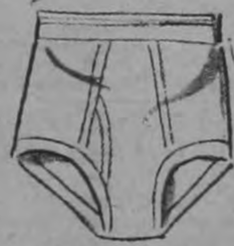
CALZONCILLOS ₡ 5.50

antes ₡ 7.00 100/100 algodón mercerizado. Tamaños 4, 6 y 8.