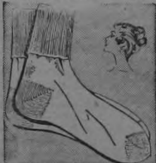
MEDIAS PARA ESCOLARES ₡ 2.95

Extrafuertes, lavables. Vari colores. Tallas del 6 al 14. Para ballet y gimnasia.