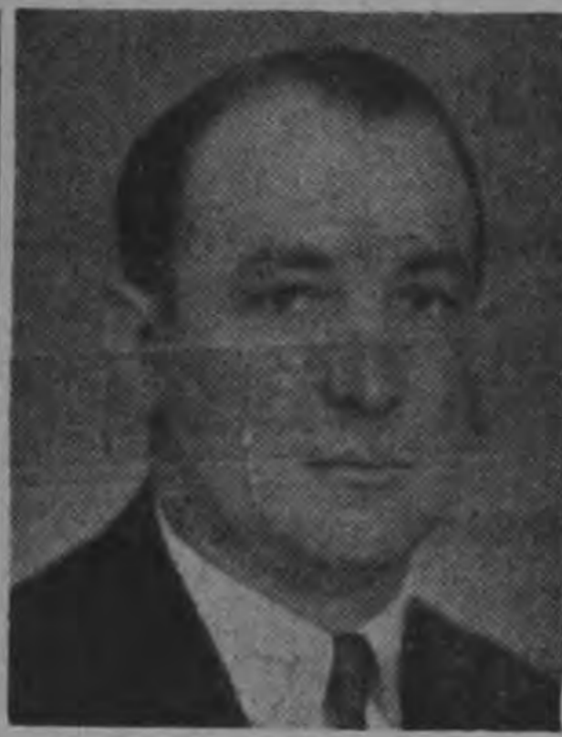
lial Ex Combatientes felicitamos la democrático triunfo. Por la Filla.