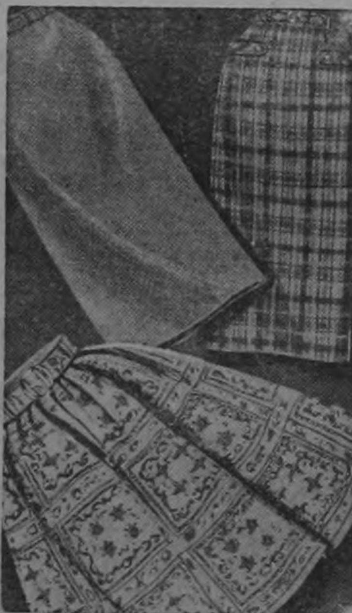
ENAGUAS PARA UNIVERSITARIAS

antes ₡ 4.95 Finas, resistentes, con costura. En todos los tamaños. Oferta limitada.