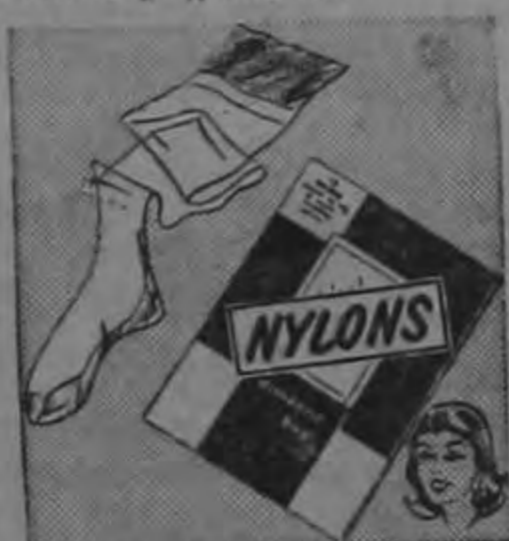
MEDIAS DE NYLON ₡ 2.95

antes ₡ 4.25 Algodón mercerizado, reforzado con nylon. Talla 7 1/2 a 11 1/2. Todos los colores.