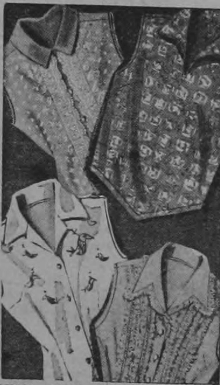
BLUSAS PARA UNIVERSITARIAS Camiseras y tipo sport. Diferentes estilos y colores. Tallas del 8 al 18. Telas sanforizadas (wash and wear) ₡ 19

antes 2 x ₡ 12.95. Suaves y resistentes. Máxima comodidad. Piernas con elástico. Tallas del 7 al 14.