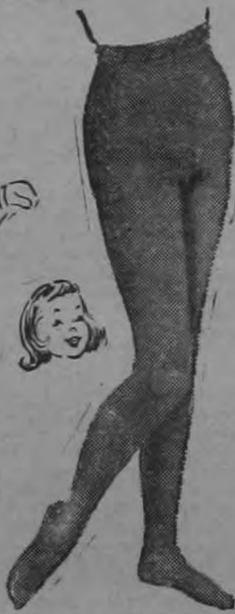
MALLAS DE NYLON ₡ 19.95

antes ₡ 24.50 En algodón sanforizado. Amplísima falda, ideal para Kinder. Tallas de 4 a 6 años.