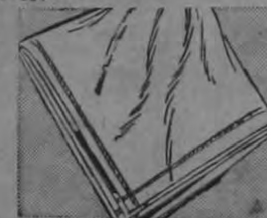
PAÑUELOS ₡ 0.75

Para escolares. 100 x 100 algodón mercerizado. Surtido de colores.