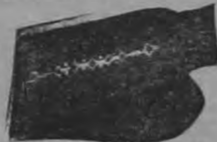
ALCETIN PARA ESCOLARES Y COLEGIALES. ₡ 2.95

antes ₡ 7.00 100/100 algodón mercerizado. Tamaños 4, 6 y 8.